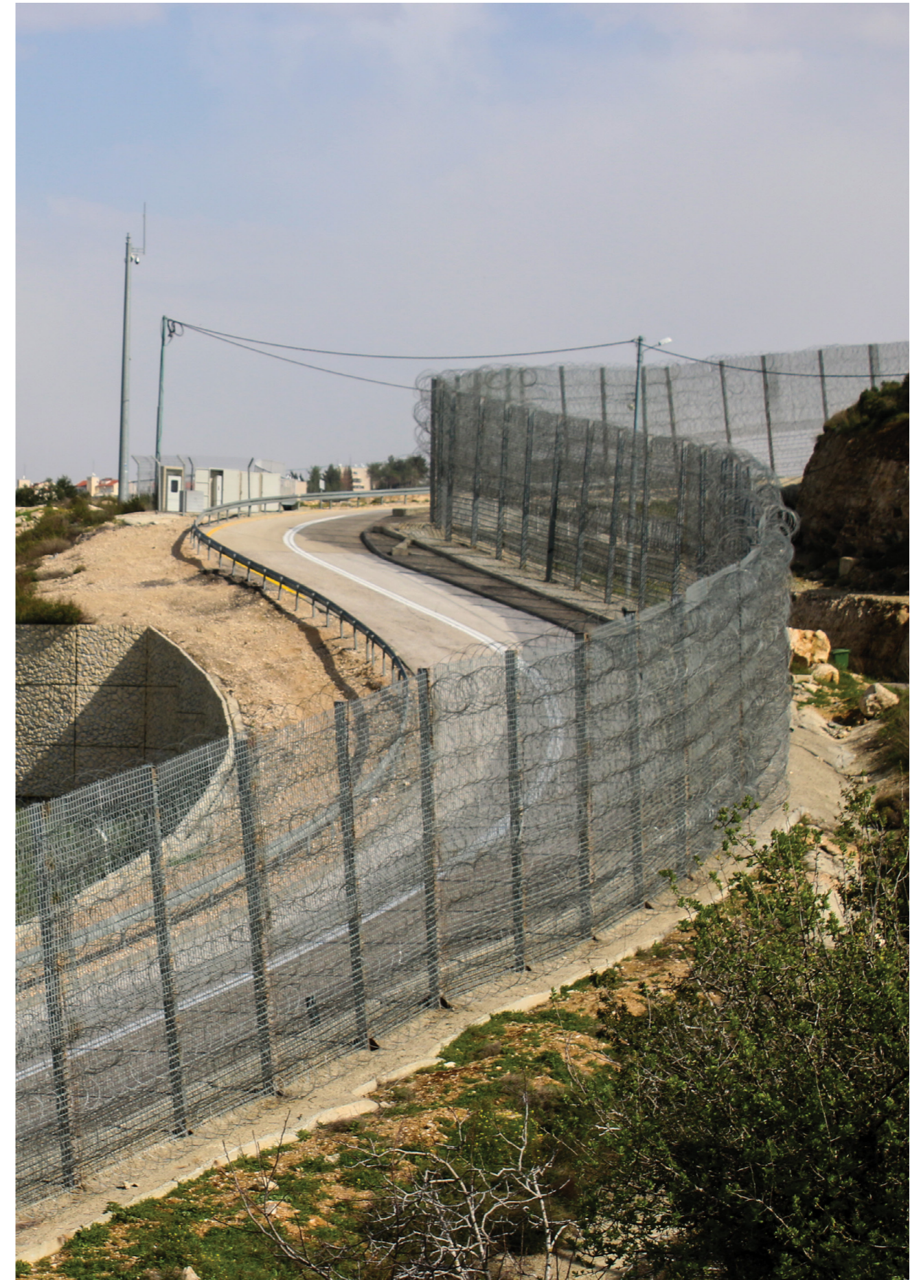
Le mur construit par Israël au début des années 2000, séparant le village d'Al Walaja de son environnement immédiat. Il comporte à la fois des portions en béton et en fil barbelé, avec une route militaire encerclant son périmètre pour le déplacement de l'armée israélienne.