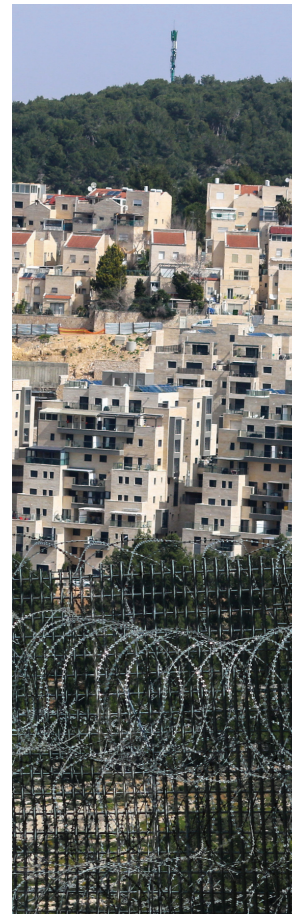
Vue de la colonie israélienne illégale de Gilo depuis l'intérieur d'Al Walaja, avec le mur militaire israélien entre les deux.

Le développement d'un deuxième étage avait pour objectif d'ajouter plus d'unités à la clinique, comme la médecine interne, une unité de lutte contre les infections, de soins pédiatriques et un laboratoire. La construction a débuté en 2020.