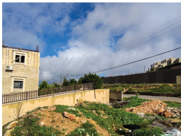
À droite de l'image se trouve la clinique d'Al Walaja, avec le mur israélien et la colonie israélienne illégale de Har Gilo de l'autre côté de la route, équipée de caméras faisant face au centre de santé. Le barrage routier militaire israélien est à quelques mètres seulement (Médecins du Monde Suisse, 2024)

Les restrictions d'accès aux services de santé de base en dehors d'al-Walaja contraignent la population à adopter des mécanismes d'adaptation nocifs, notamment en reportant leur accès à des soins de santé essentiel (voir page 15-16).