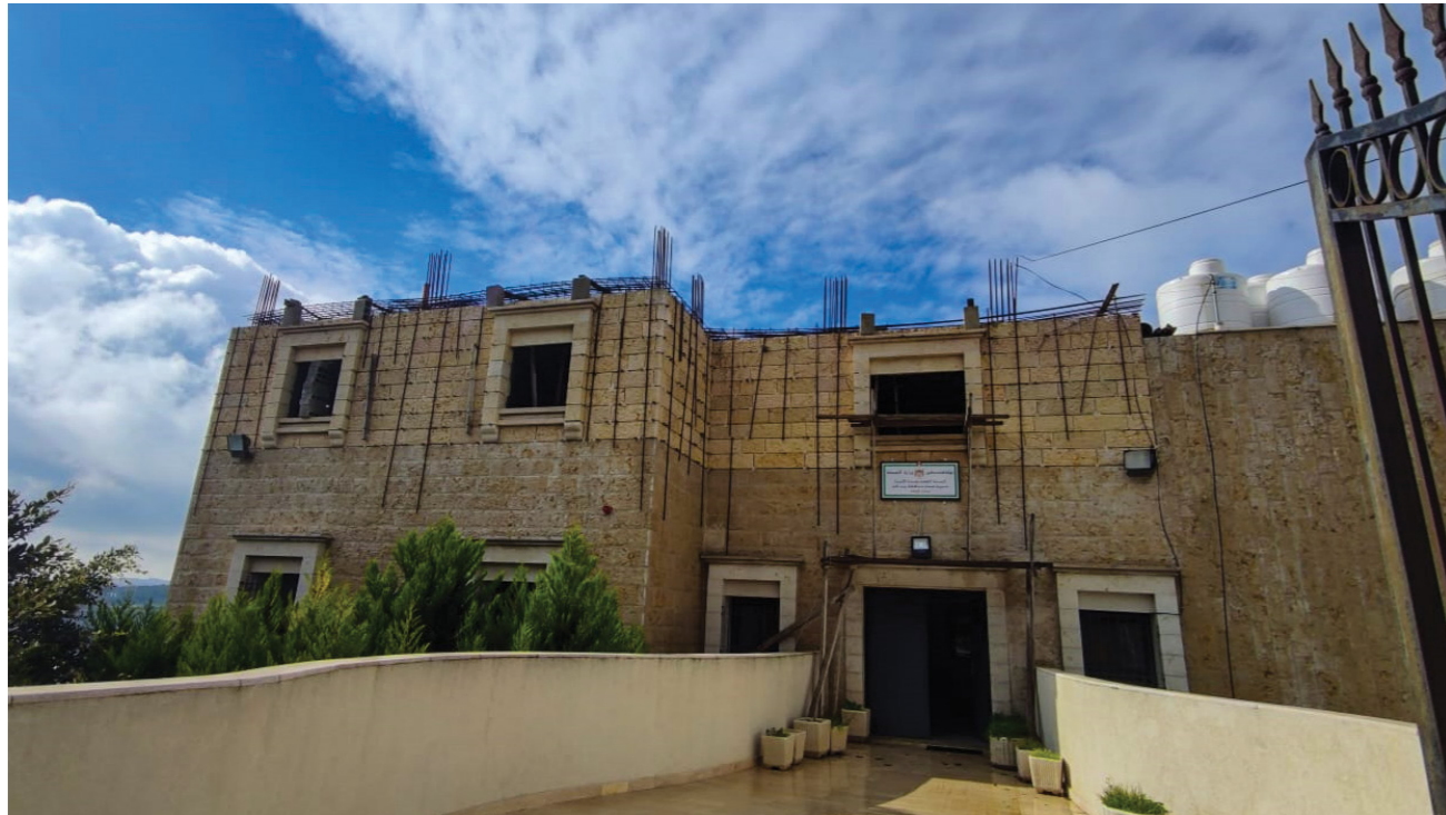
La clinique d'Al Walaja, avec des matériaux de construction toujours présents au deuxième étage, car les autorités israéliennes empêchent leur enlèvement après l'émission de l'ordre militaire d'arrêt des travaux.

Depuis le 7 octobre 2023, les forces armées israéliennes ont considérablement renforcé cette politique, en rompant les liens territoriaux entre les villes, les villages et les communautés 3 , et de ce fait, en perturbant les services de santé publique, les établissements scolaires, les moyens de subsistance, les relations sociales et l'accès humanitaire.