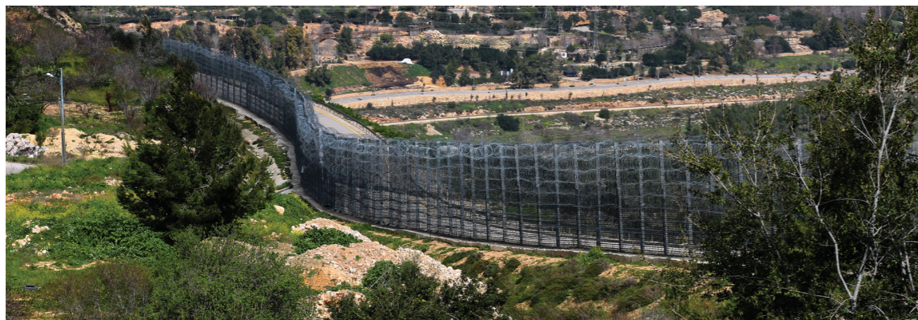
La route menant à Al Walaja depuis Bethléem. Le mur israélien longe la colonie israélienne illégale de Har Gilo. Le barrage routier militaire israélien se trouve juste après le rond-point, à côté de l'entrée de la colonie illégale (aucune image du barrage n'a pu être capturée pour des raisons de sécurité, car l'entrée de Har Gilo est constamment surveillée par des gardes colons).

Compte tenu du nombre de personnes atteintes de maladies chroniques à al-Walaja, il est également impératif d'installer un laboratoire dans la clinique. Au moins 28 habitants d'al-Walaja souffrent d'hypertension, de diabète ou de maladies thyroïdiennes ou ischémiques.