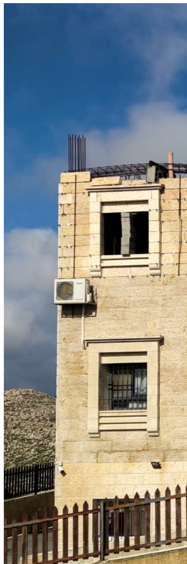
La clinique d'Al Walaja, avec des matériaux de construction toujours présents au deuxième étage, car les autorités israéliennes empêchent leur enlèvement après l'émission de l'ordre militaire d'arrêt des travaux. (Médecins du Monde Suisse, 2024)

Depuis sa mise en place, la clinique d'al-Walaja et ses professionnels de santé ont régulièrement subi harcèlement et menaces de la part des soldats israéliens et des colons.