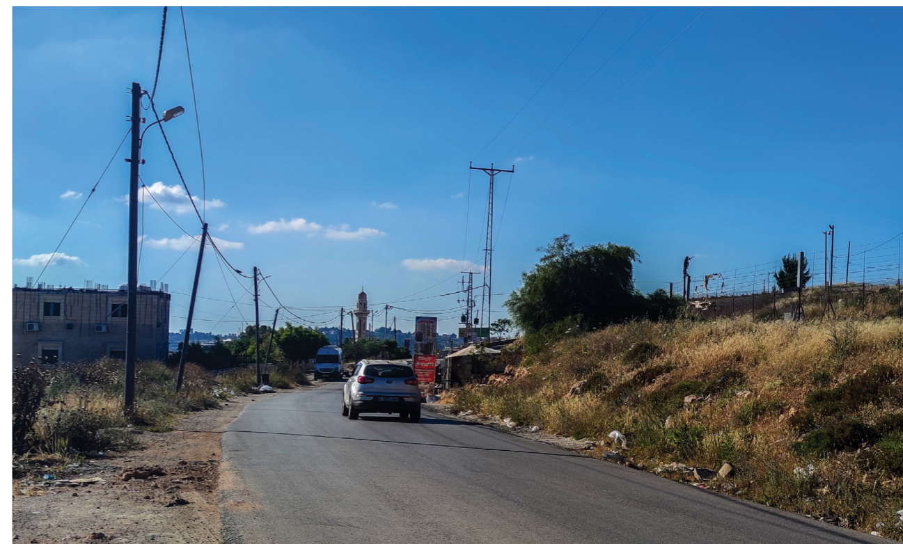
À droite de l'image se trouve la clinique d'Al Walaja, avec le mur israélien et la colonie israélienne illégale de Har Gilo de l'autre côté de la route, équipée de caméras faisant face au centre de santé. Le barrage routier militaire israélien est à quelques mètres seulement.

MdM opère à al-Walaja depuis 2018. MdM travaille en étroite collaboration avec la clinique d'al-Walaja et ses professionnels de santé, en soutenant l'intégration de la santé mentale dans les soins de santé primaires via le financement et le développement d'une unité de santé mentale et soutien psychosocial (SMSPS) dans la clinique. MdM fournit également des services d'urgence de SMSPS aux habitants d'al-Walaja touchés par des incidents liés à l'occupation tels que la démolition de leur domicile et la violence exercée par les colons.